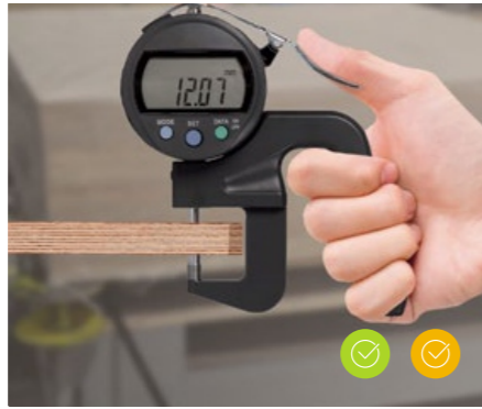
厚度偏差 \pm 0.2 釐米