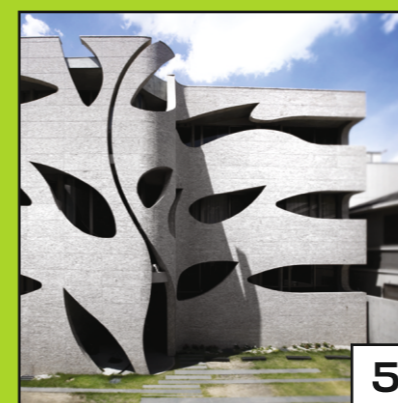
FAÇADE CURVILIGNE ET ÉLÉMENTS DE BÂTIMENT