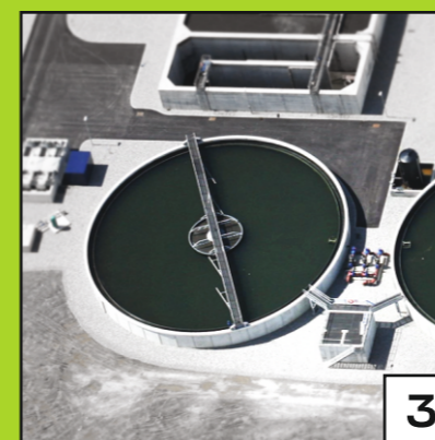
INSTALLATIONS DE TRAITEMENT