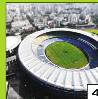
INSTALLATIONS SOCIALES/ SPORTIVES