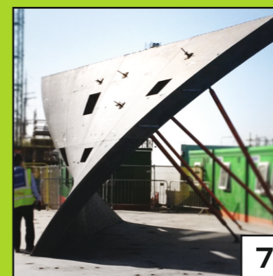
INSTALLATIONS ARCHITECTURALES COMPLEXES